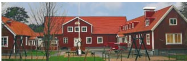
Förskolan Guldgrovan i Skummeslövsgård. Invigd januari 2010

Normalt sett, börjar man exploatera ett område med att först bygga bostäderna och sedan eventuellt komplettera med en förskola eller skola. Med Skummeslövsgård har vi gjort precis tvärtom. Vi började med att bygga förskolan. Fastigheten som skolan inryms i står redan klar och har så gjort sedan början av förra seklet. Fram till cirka 1920 tjänstgjorde Skummeslövsgården som en del av en jordbruksfastighet. Sedan dess har gården fått tjänstgöra som både barnkoloni, semesterhem och konferensanläggning. Verksamheten i förskolan har just börjat och runt denna kommer vi inom en snar framtid även att bygga tre flerfamiljshus med sammanlagt 24 lägenheter med bostadsrätt samt färdigställa 21 tomter för valfri byggnation i egen regi.